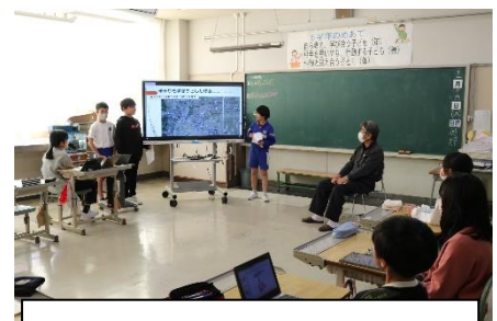
電子黒板の操作は全部自分たちで

4年生では自分の考えをタブレットに入力し、他の人と交流していました。3年生でもドリル学習に取り組んでいました。GIGA スクール構想から3年が経過し、学校での学びも様変わりしています。ICTの利活用は情報化社会を生き抜く今の子ども達にとって、必要不可欠なツールです。そして私たち教員もアップデートをしないとイケない時代です。これからも未来を意識した授業に取り組んで参ります。