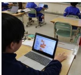
プログラムを考えます

授業をのぞいてみると、それぞれの学年が一人一台タブレットや電子黒板等をうまく活用して学習を進めているようすを見ることができました。6年生では家庭科で栄養バランスを考えた献立づくりのため、ICT 支援員の先生から指導を受け、プログラム学習に取り組んでいました。5年生では電子黒板を利用して、田んぼの先生にプレゼンを行っていました。