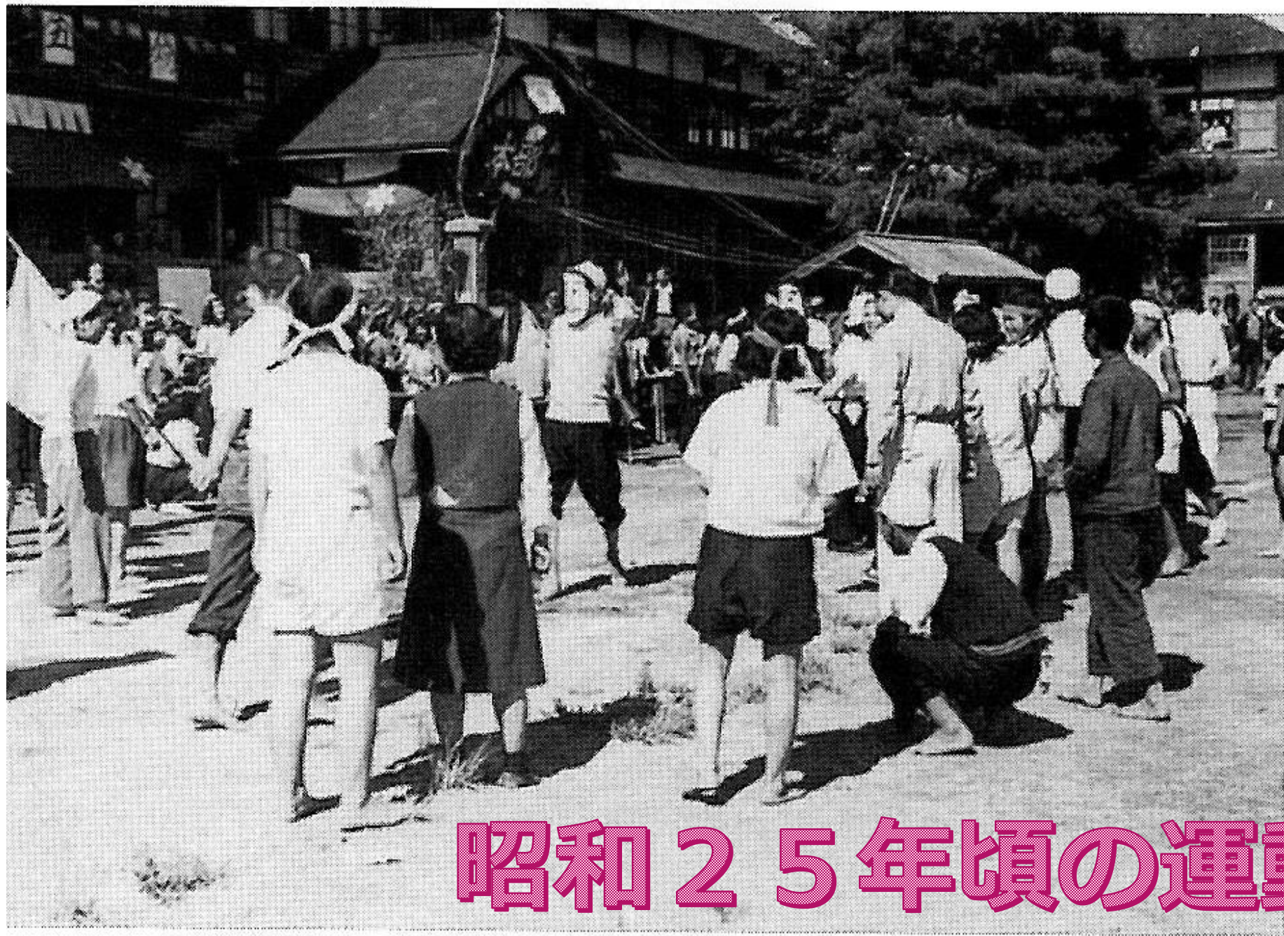
昭和25年頃の運動会