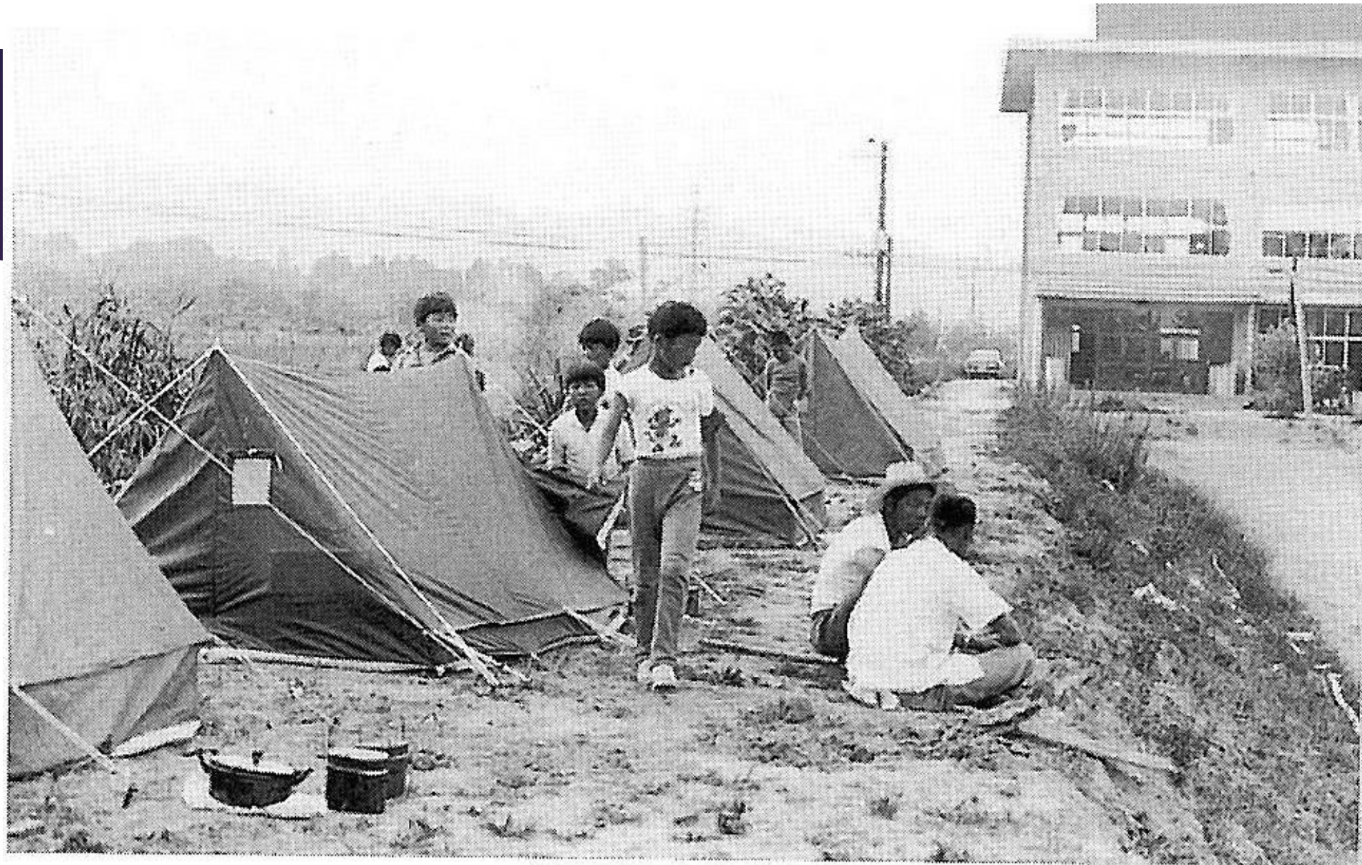
昭和50年 校庭キャンプ