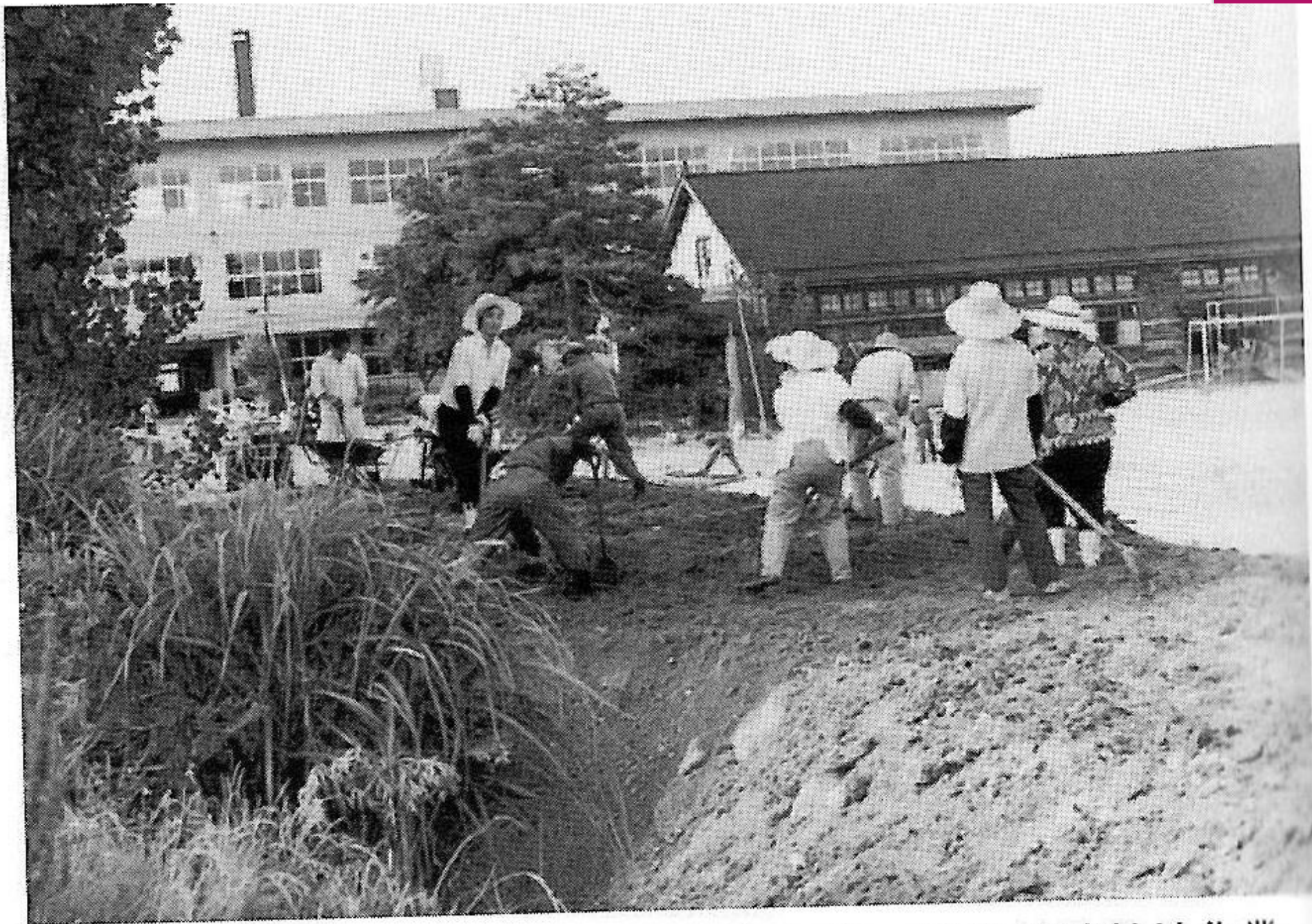
昭和49年 PTA校地整地作業